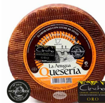
QUESO DE OVEJA SEMI ANTIGUA QUESERÍA (3,3kg aprox.) 031103