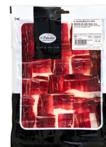
JAMÓN BELLOTA IBÉRICO 75% RAZA IBÉRICA SELECCIÓN EL PALADAR (100gr.) 24116