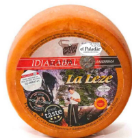
QUESO IDIAZABAL D.O. AHUMADO 031019