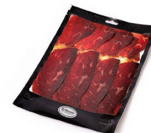
CECINA DE VACA 100G ESPAÑA 024097