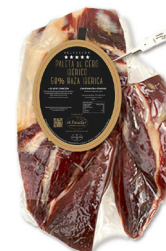
PALETA DE CEBO IBÉRICO 50% RAZA IBÉRICA DESHUESADA (SELECCIÓN EL PALADAR) 010017