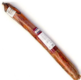
LOMO DE BELLOTA IBÉRICO 50% RAZA IBÉRICA JULIÁN MARTÍN 021036