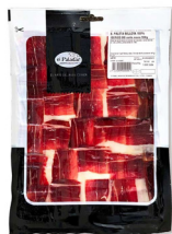
PALETA BELLOTA 100% IBÉRICO D.O. (SELECCIÓN EL PALADAR 100g.) 24049