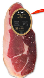
1/2 JAMÓN DE BELLOTA IBÉRICO 75% RAZA IBÉRICA DESHUESADO (SELECCIÓN EL PALADAR) 100024