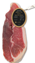
1/2 JAMÓN DE CEBO IBÉRICO 50% RAZA IBÉRICA DESHUESADO (SELECCIÓN EL PALADAR) 100154