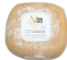
QUESO MAHÓN SON VIVES MENORCA SEMI CURADO 030090