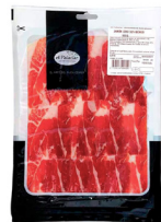
JAMÓN LONCHEADO DE CEBO IBÉRICO 50% RAZA IBÉRICO 100gr. 024007