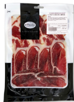
PALETA DE CEBO IBÉRICO 50% RAZA IBÉRICA LONCHEADA (100 gr.) 024005