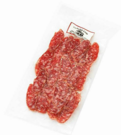
FUET DE VIC LONCHEADO 140GR. APROX. 024026