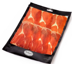
JAMÓN SERRANO RESERVA SELECCIÓN EL PALADAR (Loncheado 100 gr.) 024008

TRADITIONAL SLICED HAM / TRADITIONELL GESCHNITTEN SCHINKEN