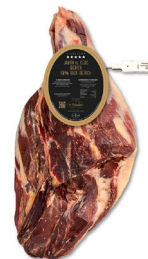
JAMÓN DE CEBO IBÉRICO 50% RAZA IBÉRICA DESHUESADO 010015