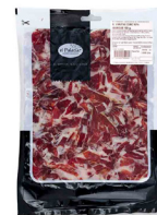
VIRUTAS DE JAMÓN DE CEBO IBÉRICO 50% RAZA IBÉRICA SELECCIÓN EL PALADAR (150 GR. APROX.) 024024