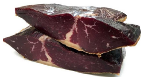
CECINA DE BUEY AHUMADA (BURGOS) 021010

ARTISANAL SAUSAGES / HIGH QUALITY CHEESE HANDGEMACHTE WÜRSTE/QUALITÄT KÄSE