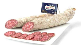
SALCHICHÓN IBÉRICO EXTRA JULIÁN MARTÍN 021003