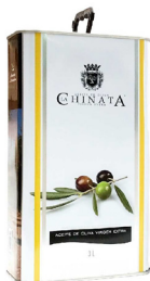
ACEITE DE OLIVA VIRGEN EXTRA LA CHINATA 1L 201743