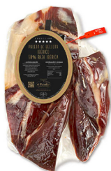
PALETA DE BELLOTA IBÉRICO 50% RAZA IBÉRICA (SELECCIÓN EL PALADAR) 000800