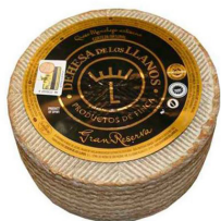
QUESO DEHESA DE LOS LLANOS GRAN RESERVA 031012