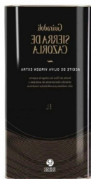
ACEITE DE OLIVA VIRGEN EXTRA SIERRA CAZORLA (Lata 5l) 202050