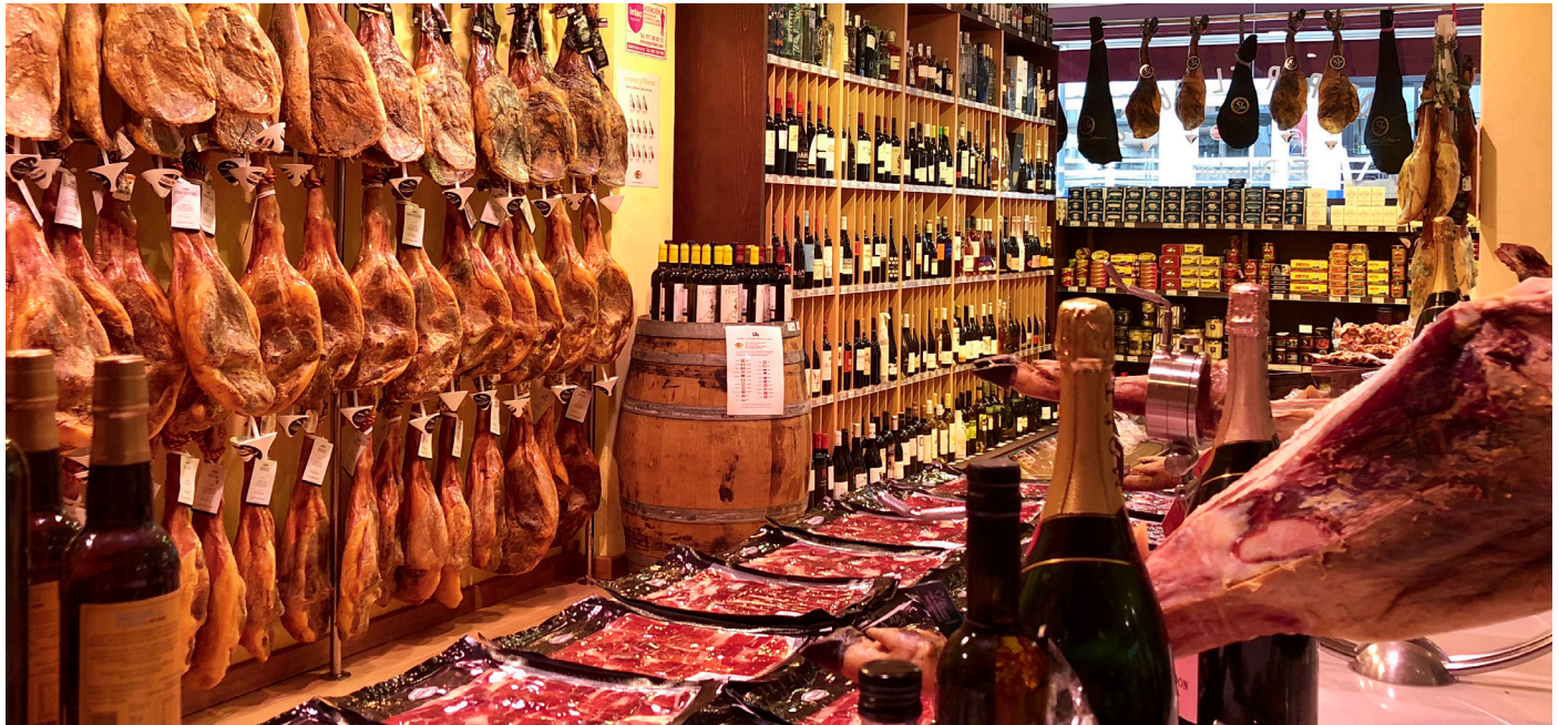
EL PALADAR HAM STORE & DELICATESSEN / EL PALADAR SCHINKENLADEN UND DELICATESSEN

Con más de 20 años de experiencia en el sector, somos líderes y servimos por toda Europa.