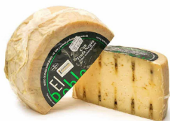
QUESO DE OVEJA CON TRUFA CAMPOLLANO 033097