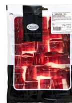
JAMÓN DE CEBO IBÉRICO 50% RAZA IBÉRICA SELECCIÓN EL PALADAR (Loncheado a Mano 100gr.) 024063