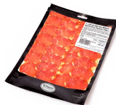
LOMO DE CEBO IBÉRICO 50% RAZA IBÉRICA SELEC- CIÓN EL PALADAR (100gr.) 024054