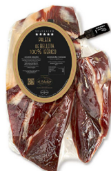
PALETA DE BELLOTA 100% IBÉRICO (SELECCIÓN EL PALADAR) DESHUESADO 010004